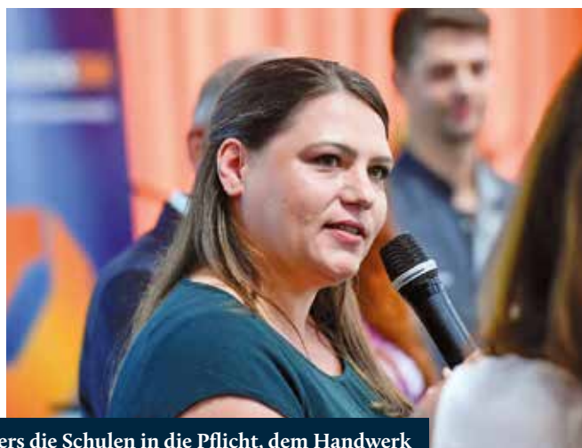
Sie nehmen besonders die Schulen in die Pflicht, dem Handwerk in der Berufsorientierung mehr Raum zu geben.