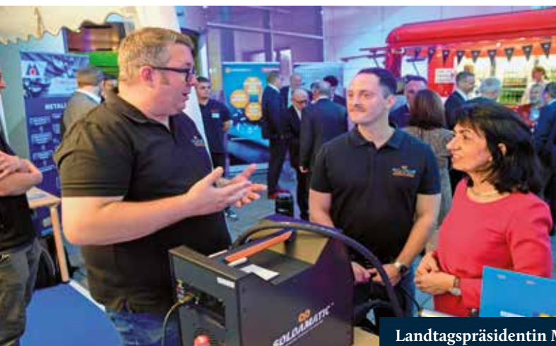
Landtagspräsidentin Muhterem Aras lässt sich in das Handwerk der Metallbauer einführen.