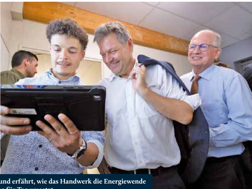
...und erfährt, wie das Handwerk die Energiewende Tag für Tag umsetzt.