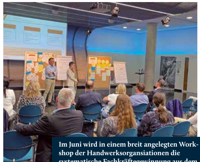
Im Juni wird in einem breit angelegten Workshop der Handwerksorganisationen die systematische Fachkräftegewinnung aus dem Ausland ab 2024 auf den Weg gebracht.