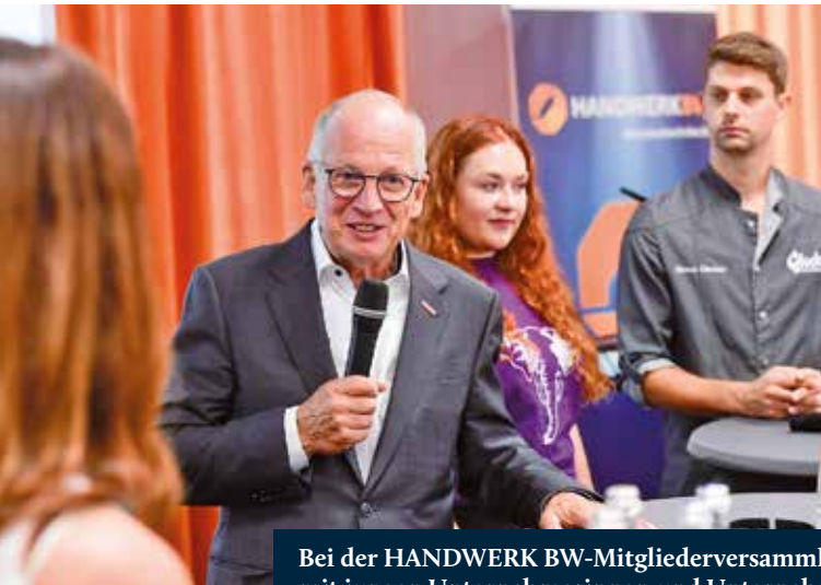
Bei der HANDWERK BW-Mitgliederversammlung im Juli diskutiert Präsident Rainer Reichhold mit jungen Unternehmerinnen und Unternehmern über die Zukunft des Handwerks.