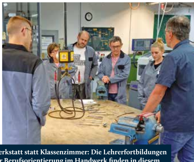
Werkstatt statt Klassenzimmer: Die Lehrerfortbildungen zur Berufsorientierung im Handwerk finden in diesem Jahr gleich mehrfach statt.